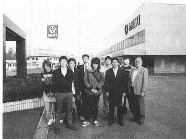
名機製作所の見学をする受講生ら