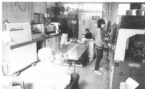
技能照査・実技試験

養成訓練（通学制）は、2月1・8日に技能照査（学科と実技）が実施された。7名全員が合格した。