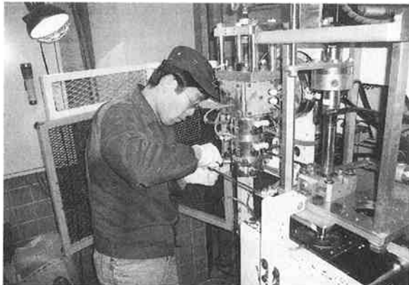
ブロー成形 実技試験

プラスチック成形・ブロー成形の実技試験が、1月21日から6日間の日程で名古屋市工業研究