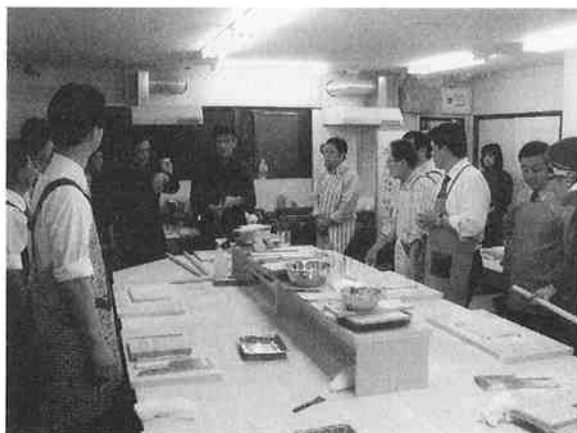
蕎麦打ち体験をする参加者ら

（つなぎ2割、そば粉8割）と外二八（つなぎ2割、そば粉10割）があることや、真の手打ち蕎麦屋が本当に少ないことを教えて頂き、改めて驚きました。