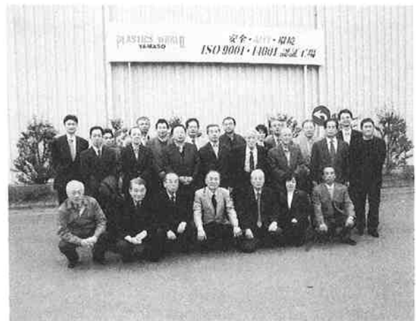
山宗浜松工場での記念撮影

翌日は、昨年同様ゴルフ組と観光組に分かれて、ゴルフ組は静岡カントリー浜岡コース、観光組は掛川花鳥園、お茶の郷博物館を訪問し、最後に大井川鉄道のSLに乗車し、各々が楽しんだ。午後には合流をし、18時頃名古屋駅に到着し、無事に合同支部会を終えることができた。