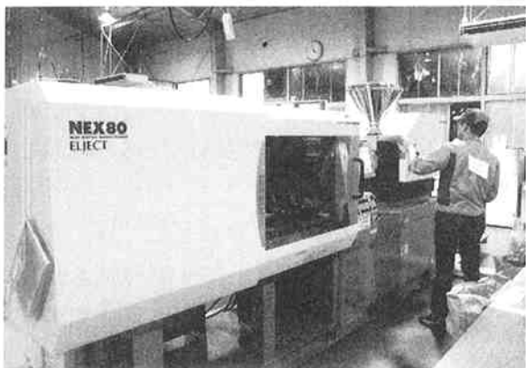
技能検定実技試験

今年度採点の基準の変更があり、試験、製品検査共に厳しくなる。また、採点会議を9月17