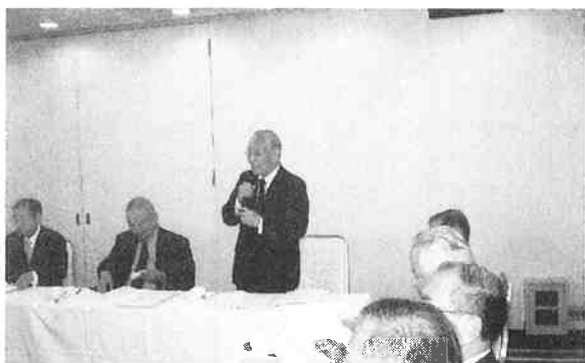
中央は挨拶する服部連合会会長