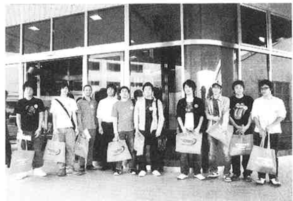
三菱電機メカトロニクスショーの会場入口で記念撮影