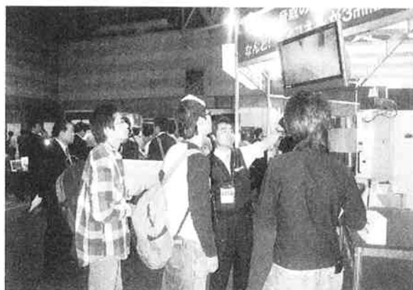
“難”加工技術展会場で出展社の説明を聞く訓練生

このコーティングの特徴としては、金型の表面膜硬度の高さです。膜が硬くて強ければ、数万ショットと成形する中で、普通なら型の寿命が来たり、型が減ってくるものですが、頑丈なため型が減ったりしません。その膜硬度の硬さは3,500Hvで、車のボディの鉄の硬さが大体200～300Hvなので、いかに硬いかが分かります。更に面精度も優れており、ワークの滑り性向上により金型への面圧、摩擦抵抗負担も軽減しました。